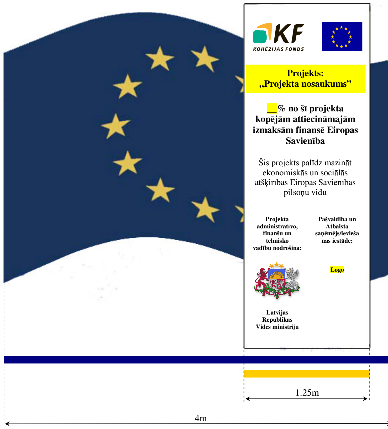
Pielikums Nr. 1

Tekstuālajai informācijai, projekta nosaukumam un KF un ES logo kopā ir jāaizņem 50% no stenda laukuma.