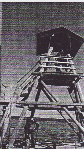
Места для VIP-персон.

валось. Чтобы видеть, надо замечать. Орнитолог Янис Кюзе, работник Национального парка, учил нас как раз этому.