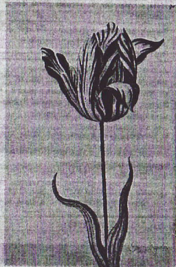
Луковица этого тюльпана ( Semper Augustus ) продана за рекордную цену — 6000 флоринов (это стоимость 200 свиней или 60 коров).