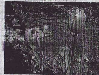
Тюльпаны из сада журналиста Анжелы Гаспарии.

Название «тюльпан» происходит от персидского слова «tuliban», что в переводе значит «тюрбан» — тра-