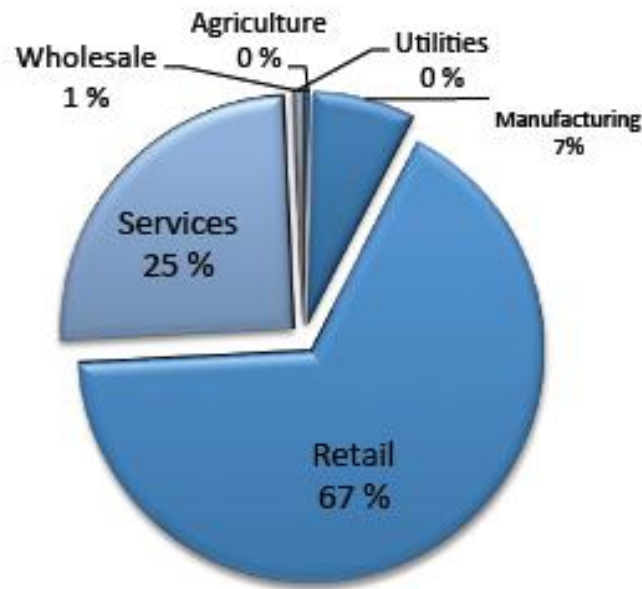
Sadalījums pēc apgrozījuma (2012)

Starp ražošanas nozarēm dominējošās ir metālapstrāde, elektrotehnika, plastmasas elementu ražošana, koka karkasa māju un mēbeļu ražošana.