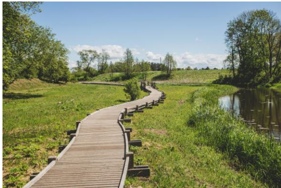
Autors: Dienvidkurzeme Travel