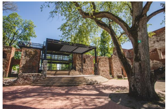
Autors: Dienvidkurzeme Travel