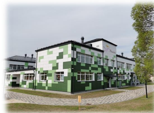
Tukuma PII «Pasaciņa»