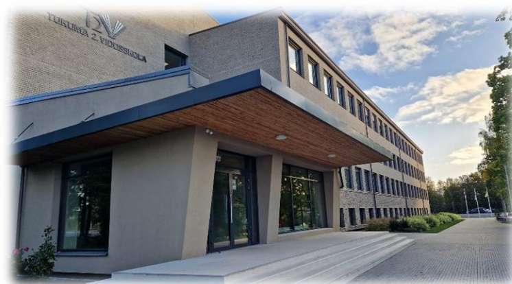
Tukuma 2. vidusskola

Līgumam pievieno pielikumu ar noteikumiem par ēkas ekspluatācijas pasākumiem