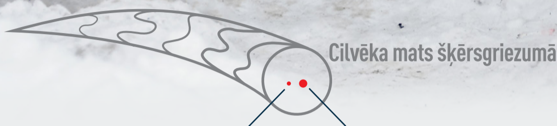
Cilvēka mats šķērs griezumā

Gaisa piesārņojums ir jebkuras gaisā esošās gāzveida vielas un smalkās daļiņas, kas var kaitēt cilvēkiem, dzīvniekiem un videi. Par neredzamajiem putekļiem sava izmēra dēļ tiek dēvētas PM 2,5 un PM 10 gaisā esošās smalkās daļiņas, kuru galvenie avoti Latvijā ir malkas apkure un transports. Smalkās daļiņas caur elpceļiem nonāk cilvēka organismā un izraisa hronisku elpceļu slimību saasināšanos vai ilgtermiņā – jaunas saslimšanas.