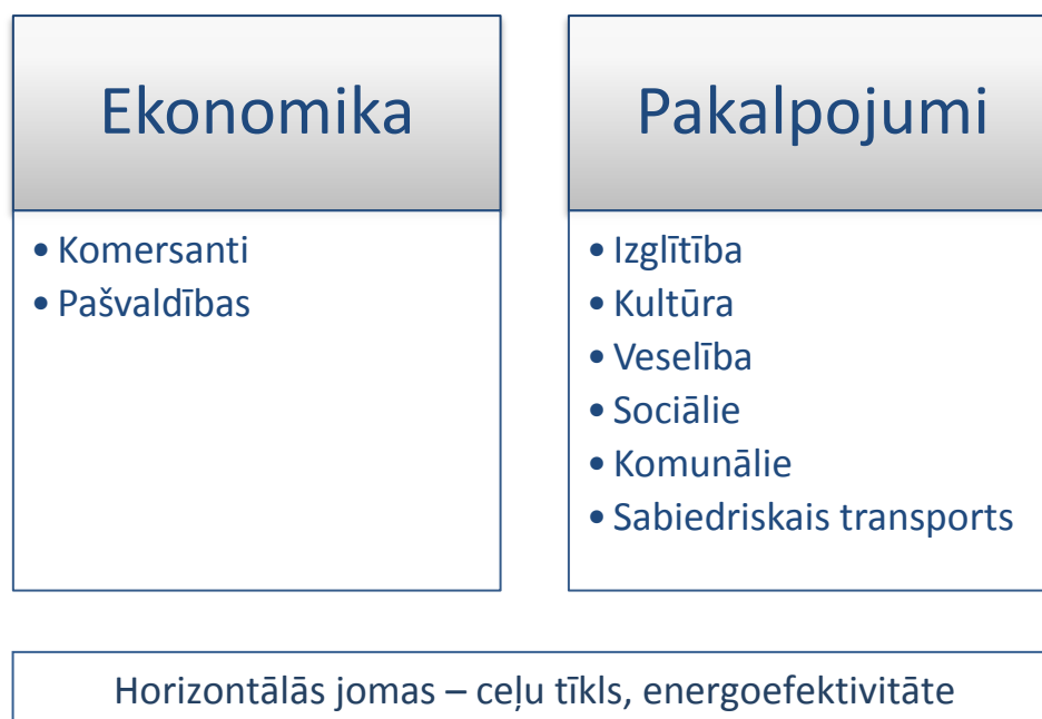
Attēls nr. 3. Uzraudzības un novērtēšanas struktūra ziņojuma ES fondu ietekme uz teritoriju attīstību ietvaros

(56) Kārtību, kādā ES fondu vadībā iesaistītās institūcijas uzrauga un izvērtē ES fondu ieviešanu, izveido un izmanto KP VIS, nosaka MK noteikumi par ES fondu uzraudzību un izvērtēšanu.